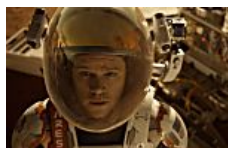
The 25 best films of 2015: Star Wars, Mad Max, The Assassin and South China Morning Post