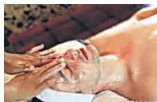
男人老化如何逆转