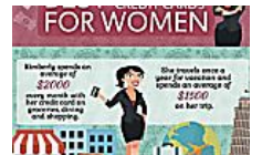
Infographic: Singapore's Best Credit Card Offers for GET.com