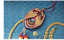
甩掉土气 金饰时髦变身