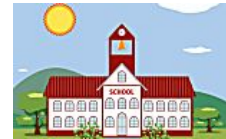
How to Choose Between International and Public Schools in The Finder