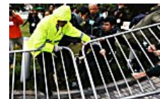
Chaos at University of Hong Kong as angry students besiege South China Morning Post