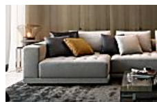
Create a home you love King Living