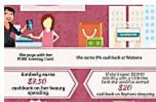
2 Best Credit Cards For Beauty in Singapore GET.com