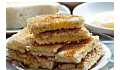
10 typical hawker breakfasts in Singapore HungryGoWhere SG