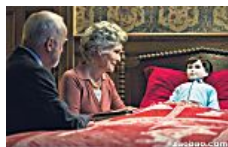
诡异娃娃 承载家族悲痛