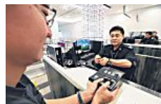
最迟6月起 所有入境者需以指纹认证通关